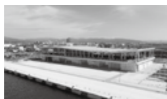
金沢港クルーズターミナル▶P.3