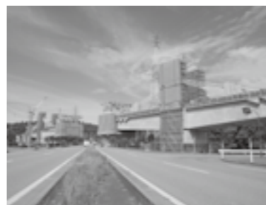
■北陸新幹線（金沢・敦賀間）細坪架道橋

細坪架道橋は国道8号と交差する橋長339mの3径間連続PCエクストラード橋です。本橋は、国道と斜めに交差することからスパンが長くなり、列車走行時の変位が課題となります。そこで、低く抑えた主塔と斜材により主桁を支える外ケーブル構造とすることで列車走行時の変位を抑制する構造形式を採用しました。本橋が完成すれば、新幹線のコンクリート橋としては国内最長スパン（支間長155m）の橋りょうとなります。