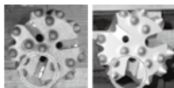
インナービット (左：改良前) (右：改良型) ▶P.7