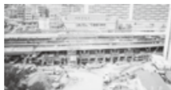
JR六甲道駅の復旧工事▶P.17