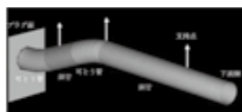
止水プラグ可とう化イメージ図▶P.5