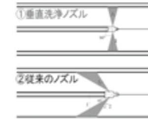
消雪パイプ高圧洗浄の効率化技術 ▶P.21