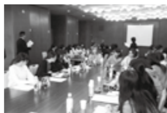
令和元年度 女子大学生と 女性技術者による座談会▶P.15