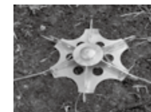
ロープ掛式ロックボルト工法 ▶P.21