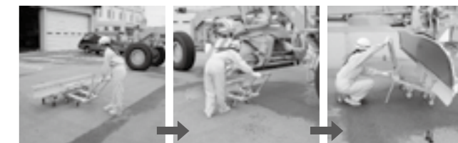
除雪グレーダーのカッティングエッジ交換装置▶P.21