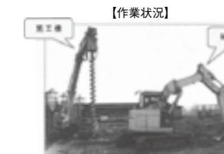
浅層中層地盤改良 「サイドプレス工法」▶P.21